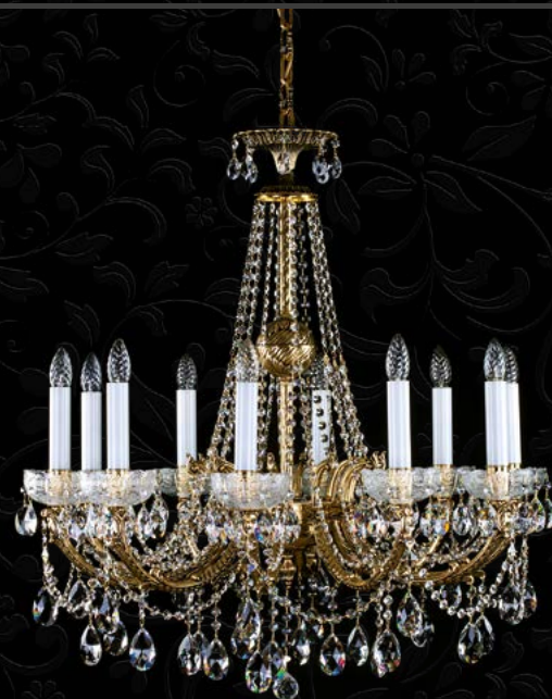
18. CR 0006/10/20 BRASS ANTIQUE | 820x850 mm | 10x40 W 24% PbO