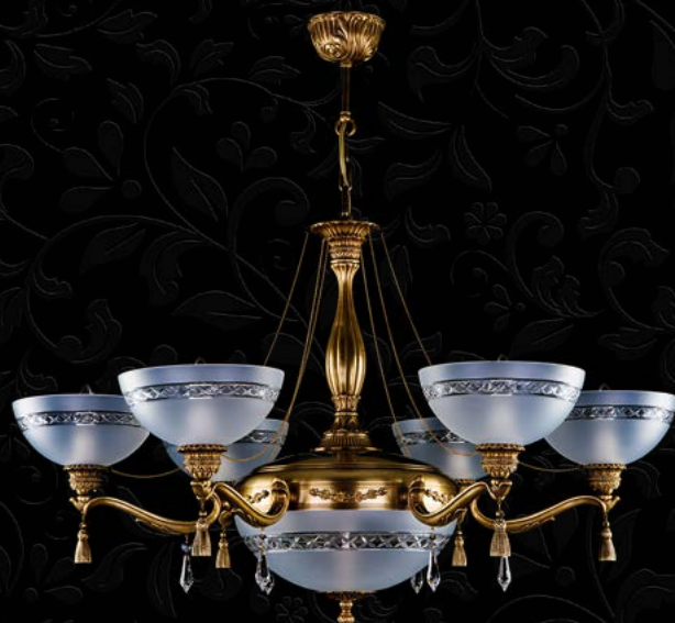
17. GOLDIE VI. LIGHT PATINA | 920x570 mm | (6+2)x40 W

CAST FITTINGS | PIEZAS MOLDEADAS | ЛИТЫЕ СВЕТИЛЬНИКИ