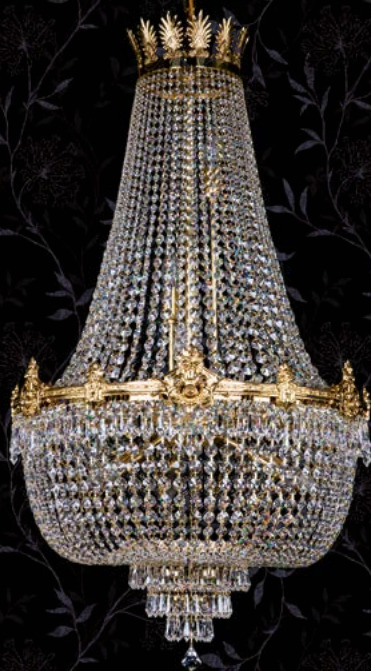
27. EVITA 600x1000 | 600x1000 mm | 12x40 W