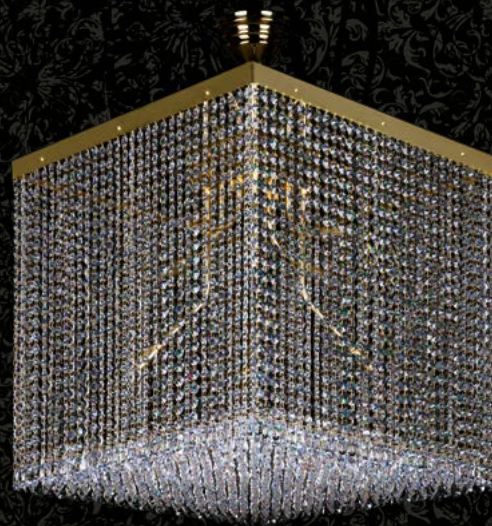
34. LEANDRA 500x500 | 500x500x500 mm | 8x35G9