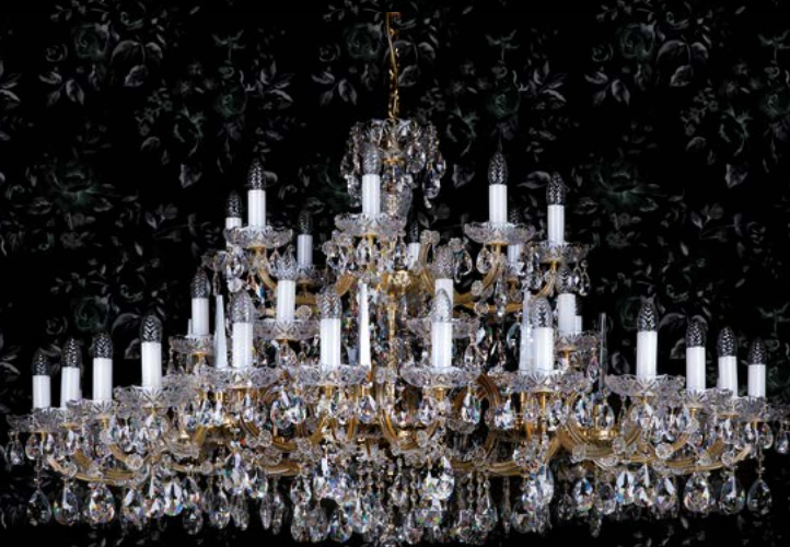
24. MARIA TEREZIA 32 | 1520x880 mm | 40x40 W