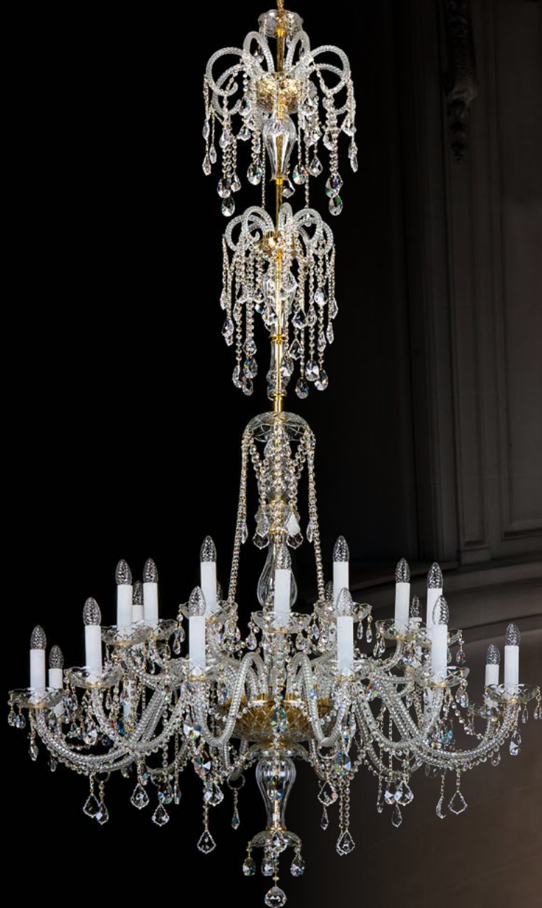
01. THEODORA XXIV. 1200x2300 | 1200x2300 mm | 24x40 W