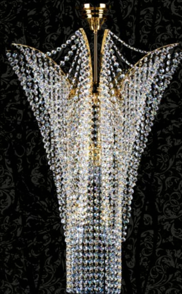
36. MELANIE dia. 550x700 | 550x700 mm | 11x40 W