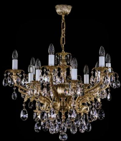
12. ETELA X. POLISHED | 720x600 mm | 10x40 W