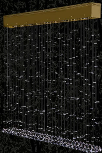
35. CURTAIN III. | 1000x1000x90 mm | 5x25 12 V