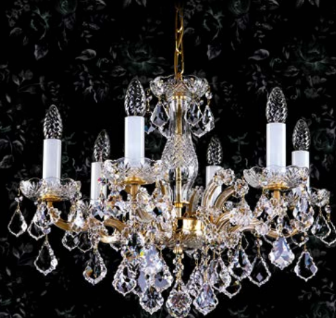
23. MARIA TEREZIA 47 | 580x430 mm | 6x40 W