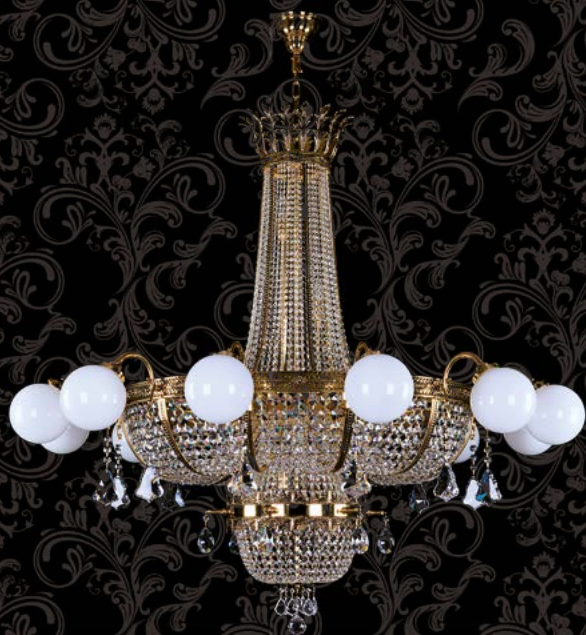
02. EURYDIKA BRASS ANTIQUE 1600x1450 1600x1450 mm | 21x60W E27+6x40W E14 W