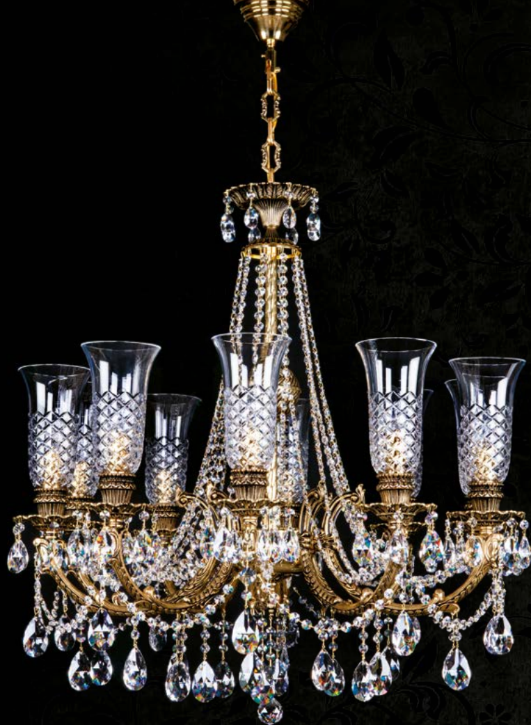
15. JANET X. POLISHED | 830x860 mm | 10x40 W