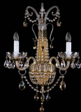
09. NADINE II. BRASS ANTIQUE - 8003 WL 480x640x260 mm | 2+1x40 W