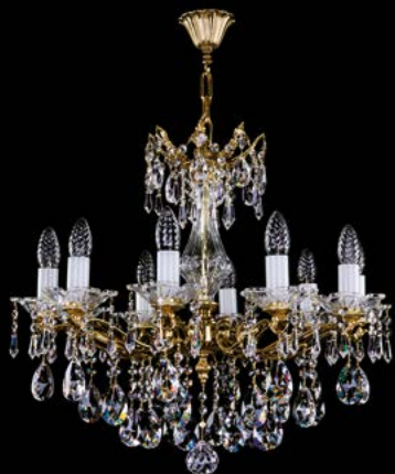
14. KATHERINE X. POLISHED | 625x530 mm | 10x40 W