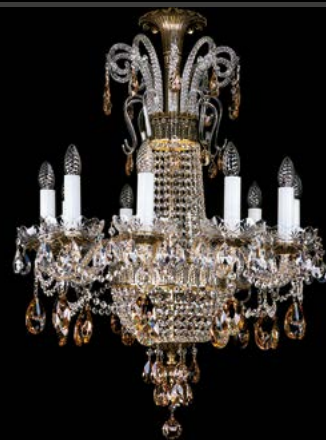
10. PROSERPINA X. BRASS ANTIQUE - 8003 680x1200 mm | 10+2x40 W