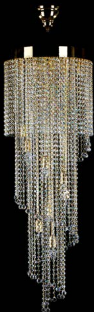
32. SPIRAL 400x1200 balls 400x1200 mm | 12x40 W

MODERN LINE | LÍNEA MODERNA | СОВРЕМЕННЫЕ СВЕТИЛЬНИКИ