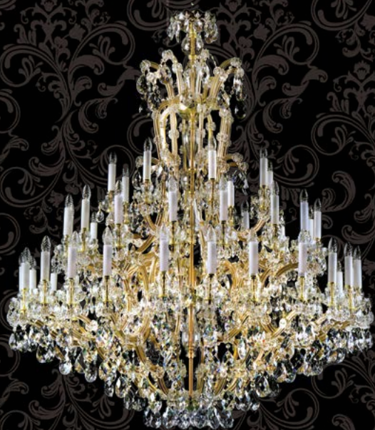
04. MARIA TEREZIA 19 | 1600x1800 mm | 48x40 W