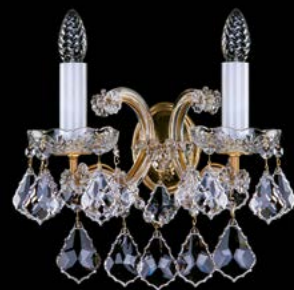
20. MARIA TEREZIA 49 WL | 330x400 mm | 3x40 W