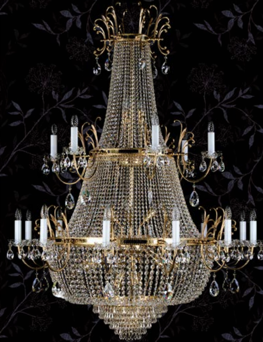
28. VIRGINIE | 1300x1660 mm | 21x40+12x60 W