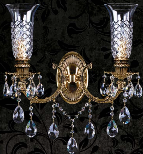
16. MILAGROS II. POLISHED WL | 400x520 mm | 2x40 W 24% PbO

CAST FITTINGS | PIEZAS MOLDEADAS | ЛИТЫЕ СВЕТИЛЬНИКИ