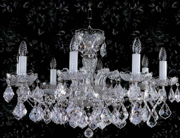
25. MARIA TEREZIA 44 NICKEL | 800x400 mm | 8x40 W