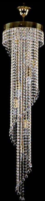
31. SPIRAL 300x1200 balls 300x1200 mm | 8x40 W