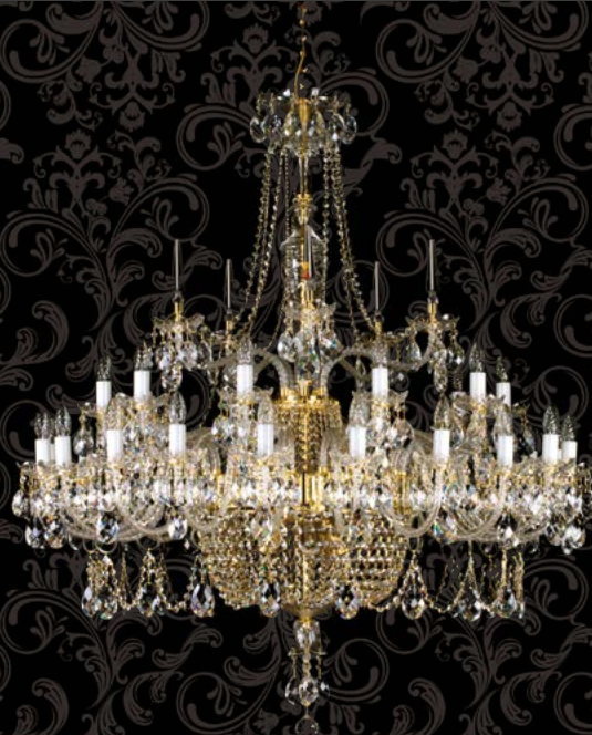
05. SARA XXX. | 1220x1300 mm | 30x40+3x60 W