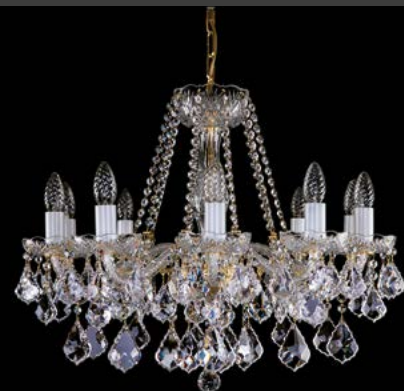
11. AEROPE X. | 660x540 mm | 10x40 W