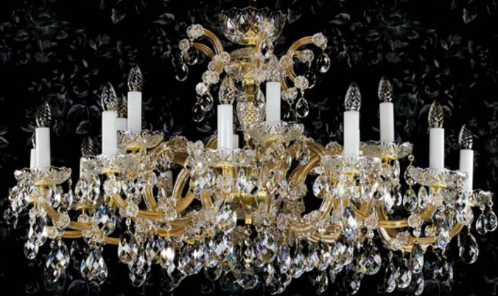
22. MARIA TEREZIA 17 | 1120x660 mm | 18x40 W