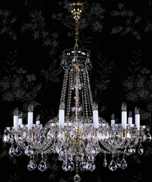
06. MELINDA XII. | 1100x930 mm | 12x40 W 24% PbO