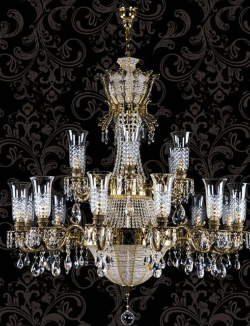
03. SIRAEL BRASS ANTIQUE | 1300x1250 mm | 21x40 W 24% PbO