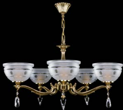
13. SAFFIRA V. POLISHED | 640x360 mm | 5x40 W