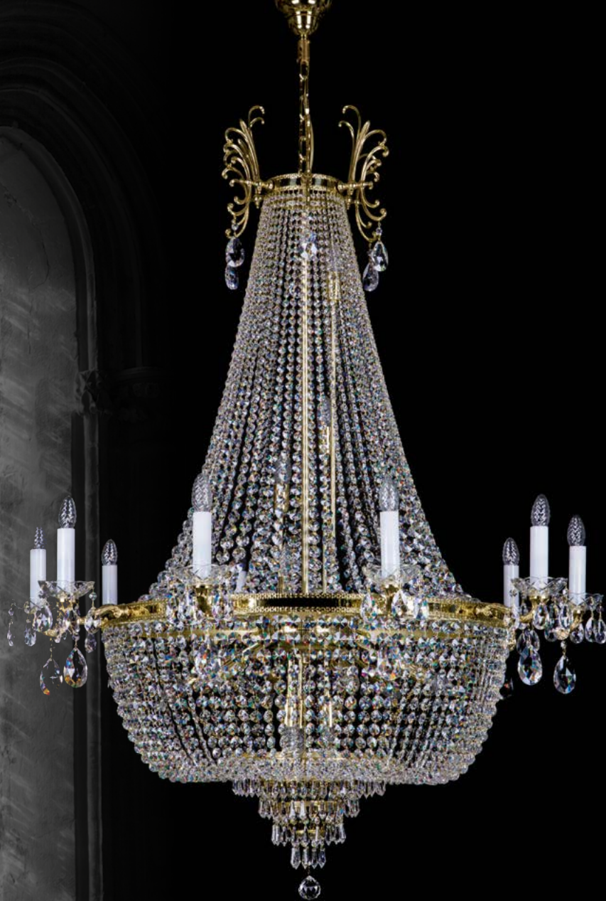
26. CHERYL dia. 1100 | 1100x1500 mm | 23x40 W