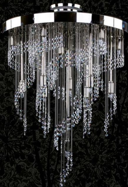
33. ERIN NICKEL | 500x600 mm | 15x35 G9