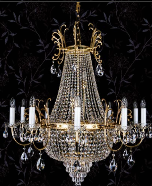
29. HILLARY dia. 1000 | 1000x1050 mm | 16x40+6x60 W