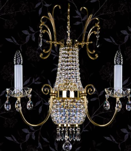
30. HILLARY 390x600 WL | 390x600x190 mm | 2x40W+2x35W G9