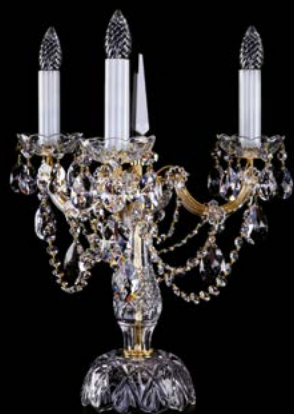
19. MARIA TEREZIA 15 TL | 380x480 mm | 3x40 W