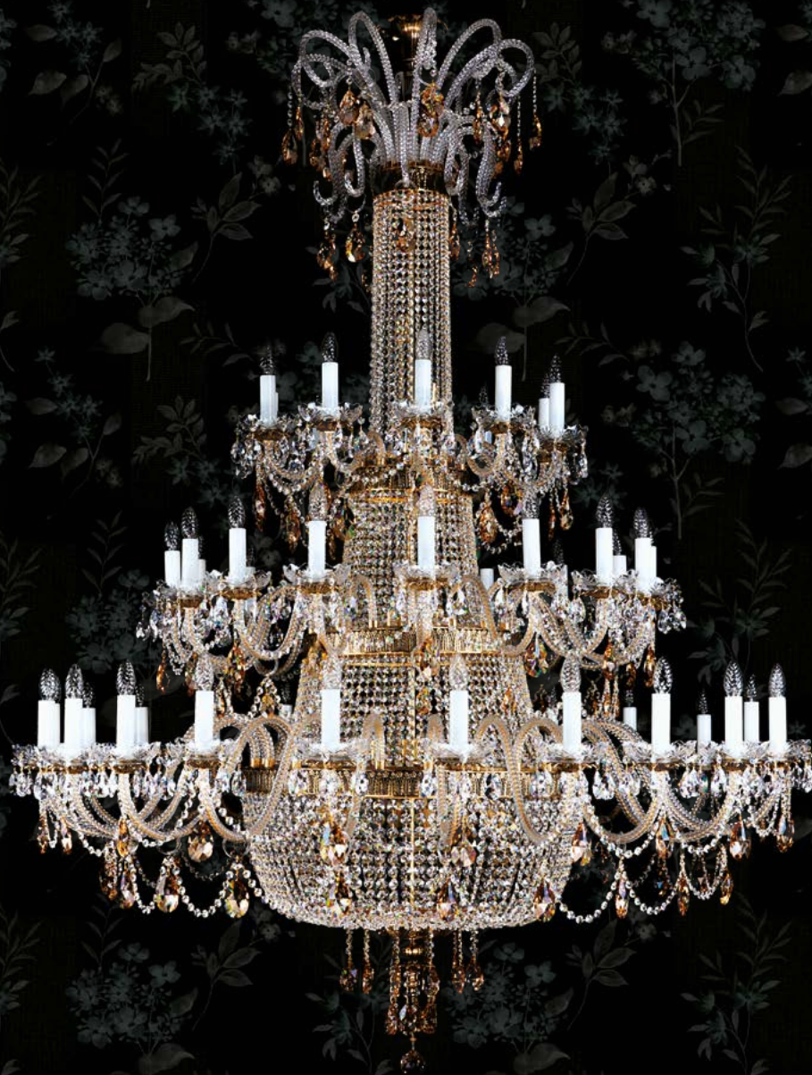
08. PROSERPINA 48 BRASS ANTIQUE - 8003 | 1600x2200 mm | 48+18x40 W

GLASS & METAL ARMS | BRAZOS DE CRISTAL & METAL | СВЕТИЛЬНИКИ ИЗ СТЕКЛА И МЕТАЛЛИЧЕСКИХ ЭЛЕМЕНТОВ