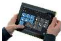
Система управления B2L (DALI)