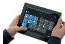
Система управления B2L (DALI)