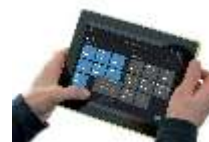
Система управления B2L (DALI)